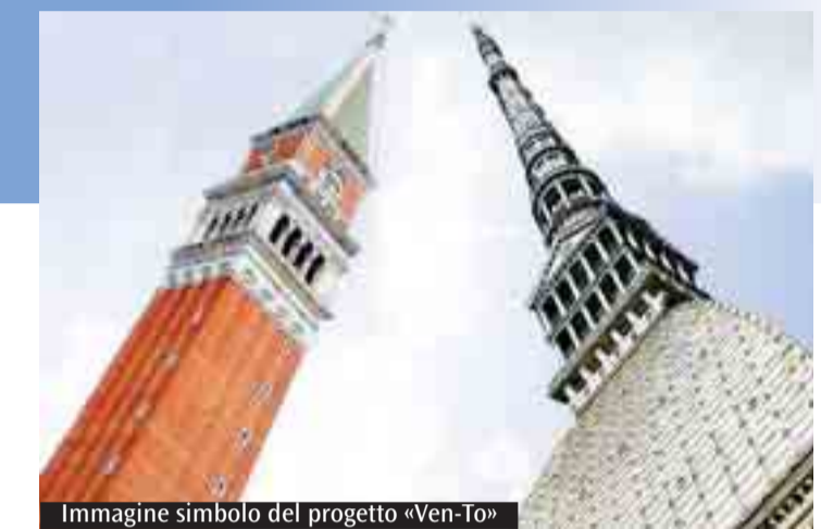
Immagine simbolo del progetto «Ven-To»

L'utenza Il Presidio sanitario San Camillo conta 100 posti letto ordinari e 20 posti letto in Day Hospital. Ogni