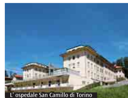
L'ospedale San Camillo di Torino

ze post chirurgiche, incontinenza sfinterica post partum. Osteoporosi e malattie osteometaboliche: il Centro è incluso nel gruppo multidisciplinare per l'appropriatezza diagnostica-terapeutica delle malattie metaboliche dell'osso istituito dalla Regione Piemonte. La sua istituzione è per fornire un approccio interdisciplinare all'inquadramento clinico, alla prevenzione, alla terapia farmacologica e alla riabilitazione delle patologie dell'osso. Riabilitazione dei disturbi pervasivi dello sviluppo: un servizio riabilitativo per i pazienti in età pediatrica e pre-adolescenziale portatori di disturbi pervasivi dello sviluppo e ritardi mentali in cerebropatie perinatali. Il servizio si avvale di tecniche cognitive-comportamentale del programma Teach, riferimento internazionale per la riabilitazione di soggetti con autismo. L'équipe è composta, oltre che da figure proprie della disciplina, anche dal neuropsichiatra infantile, dallo psicologo, dall'educatore, dallo psicomotricista e dal logopedista. Nella presa in carico del pa-