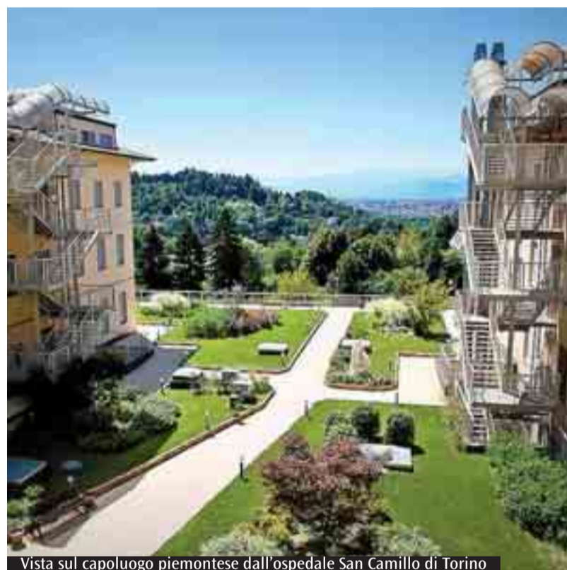
Vista sul capoluogo piemontese dall'ospedale San Camillo di Torino

terapia manuale, Logopedia, Psicologia, Neuropsicologia, Fisiatria, Agopuntura, Musicoterapia, Osteopatia, Riabilitazione specializzata dei disturbi pervasivi dello sviluppo (sindromi autistiche), Rieducazione dei disturbi dell'equilibrio, trattamento e riabilitazione delle malattie metaboliche dell'osso e dell'osteoporosi, Riabilitazione delle incontinenze sfinteriche, Trattamento del Parkinson e delle malattie demielinizzanti. Tutte queste attività sono presidiate da più di 200 persone che lavorano in struttura collaborando al raggiungimento degli ambiziosi obiettivi delle attività elencate. Il Presidio, grazie alla collocazione sulla collina torinese, possiede una disponibilità di area verde di circa 30.000 metri quadrati, per lo più